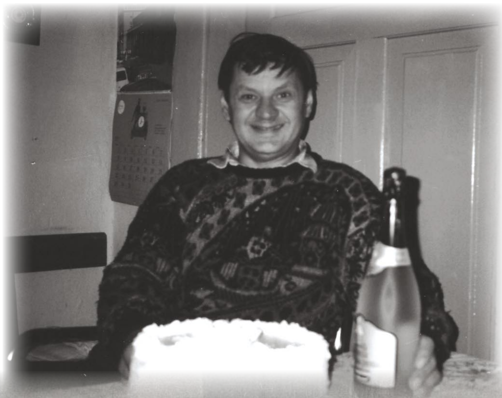
Brenc u svom toplom domu