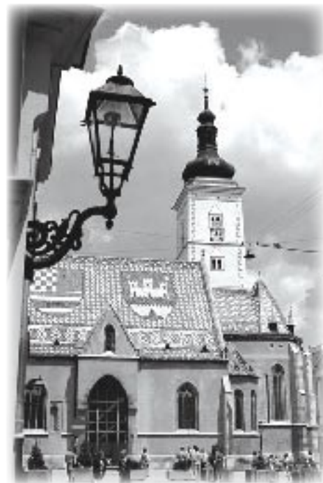
Crkva Sv. Marka

olakšava pristup zagrebačkoj Uspinjači. Sredstva za ovu investiciju osiguralo je Gradsko poglavarstvo. I najpoznatija zagrebačka tržnica Dolac također je postala pristupačna osobama koje se kreću u invalidskim kolicima. Do ugradbe