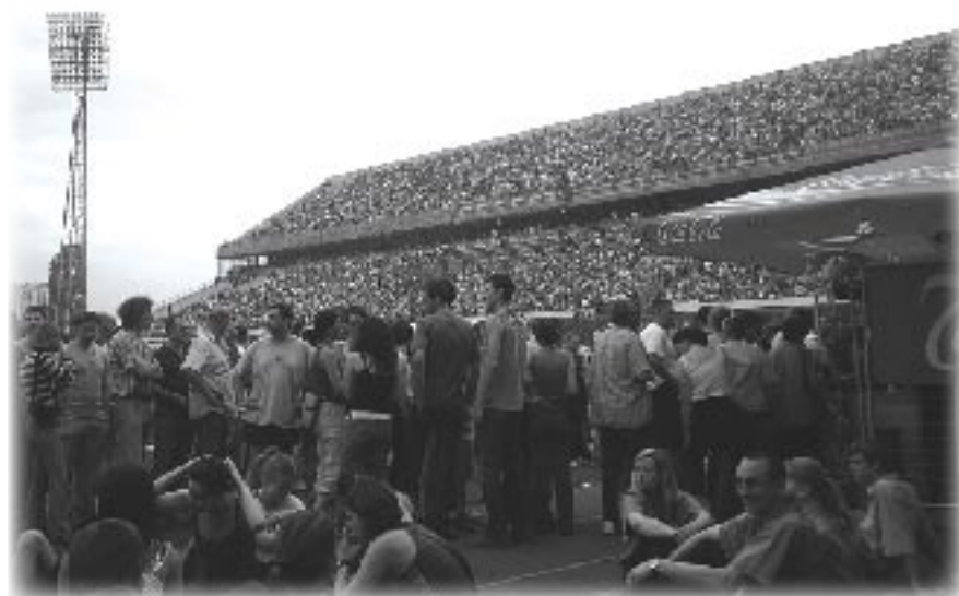
Pogled prema istočnoj tribini

Sve je započelo prije mjesec dana kad smo se prvi put obratili organizatoru koncerta. Molila sam ga da dopusti ulaz našim članovima i pratnji. Odgovorio mi je da neće biti nikakvog osiguranja, da osobe moraju potpisati da idu na vlastitu odgovornost i da pratnja mora platiti kartu. Zvala sam ga u više navrata, ali on se tvrdoglavo držao svog stava. Obzirom da su ga zvali članovi iz drugih udruga i gradova odlučio je promijeniti mišljenje i napraviti „dobro djelo“. U posljednjem razgovoru, pet dana prije koncerta, rečeno je: „Poseban ulaz za invalide je sa Zapadne tribine, invalidi su smješteni ispod Sjeverne tribine, bit će ograda, a pratnja, bez obzira što nam je pomoć, plaća 200 kn za teren.“ (Iako ta pratnja sigurno ne bi platila 200 kn za