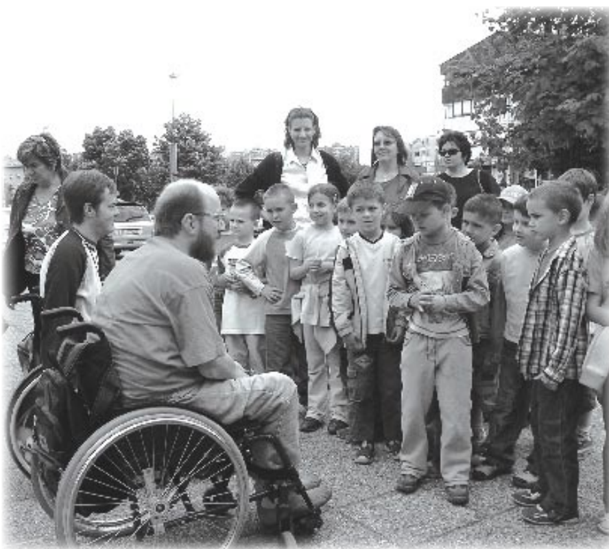
Upoznavanje s djecom iz dječjeg vrtića Jarun

izaciji Tjedna, koji su također imali veliku ulogu u nekim od događanja, među kojima su bili glumci i pjevači, a u pristupu djeci ponajprije ravnateljica jarunskih vrtića. Najveću pomoć u organizaciji Tjedna, asistirajući organizatorima, pružili su naši volonteri, ročnici