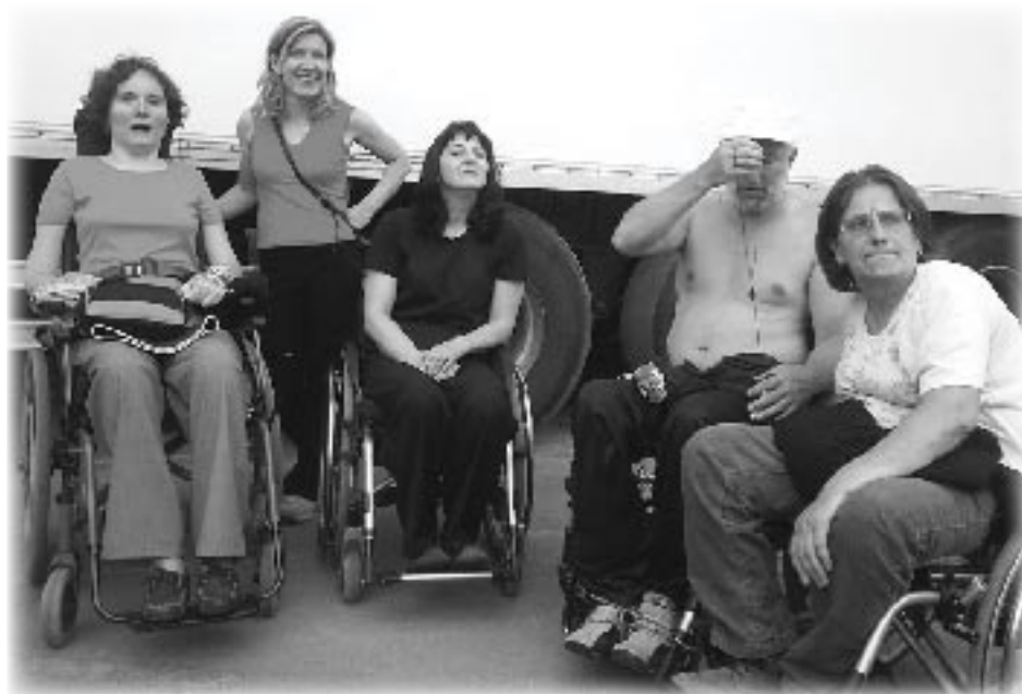
HUPT-ovci na „Gumbu“

za poseban ulaz za invalide. Kartu pratnje od 200 kn, koju smo obvezno trebali kupiti, nitko nije tražio, a na terenu nije bilo nikakve ograde... Ljudi u kolicima bili su razbacani po cijelom terenu, a kemijskog WC-a za invalide nije bilo, bez obzira što smo najavili da će minimalno 10 osoba doći u kolicima. Kao da mi ne moramo piti od 19 do 24 h po takvoj vrućini, a kamoli obavljati fiziološke potrebe. Ovo je jedan (za sad i jedini) od loših primjera gdje nam organizator doista nije želio izaći u susret. Nakon koncerta različiti su se natpisi povlačili po novinama o tome koliko nam je organizator izašao u susret, pa smo zbog toga i sami javno reagirali. Grupi Bijelo Dugme ocjena „odličan“, a organizatoru, bez obzira na velike pohvale u novinama, veliki „nedovoljan“.