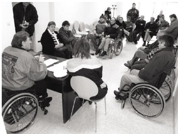
Ovako je to izgledalo u Puli