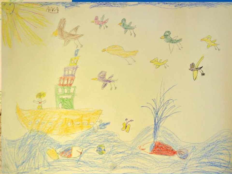
Neki od dječjih radova s radionice u sklopu Tjedna osoba s paraplegijom i tetraplegijom