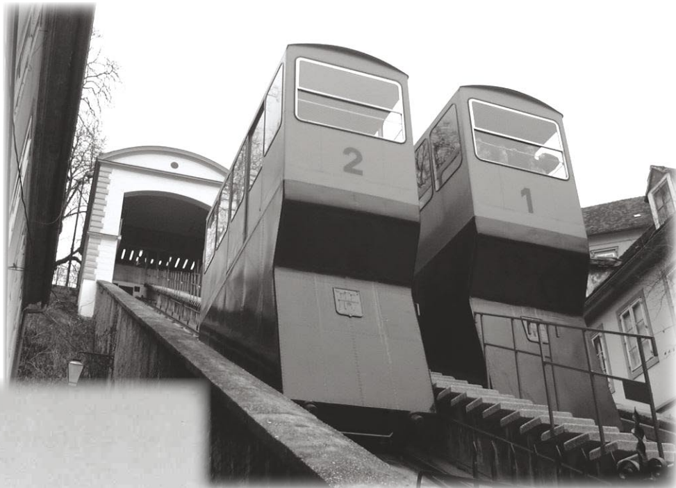
Uspinjača u Tomičevoj ulici

Još davne 1982. godine Grad Zagreb je napravio plan za dostupniju uspinjaču prije svega osobama koje se kreću u invalidskim kolicima i svima koji imaju otežano kretanje. Od ideje i planova za realizaciju proteklo je punih trinaest godina. I evo, na samom prijelazu u novu 2005.