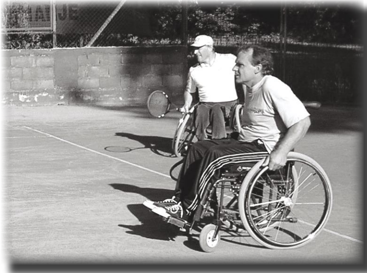
Igra u parovima

Zanimljivo, na državnom prvenstvu davne 1995. go-