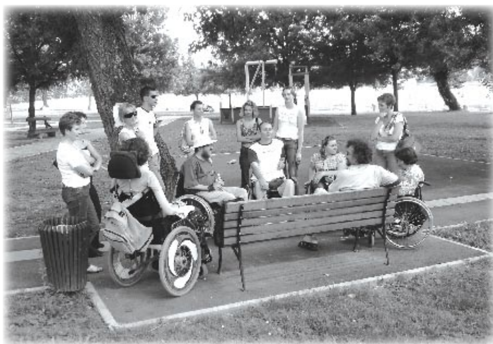
Djelatnici kućne njege „Sestra Maca“ i članovi HUPT-a

U srijedu, 8. lipnja, sve je bilo dogovoreno s gospodinom Ivićem, vlasnikom restorana „Delikates Ivić“, da se uz njihovu logistiku održi zabavna večer na terasi. Zbog loše vremenske prognoze i hladnoće sve je otkazano za 15. lipnja.