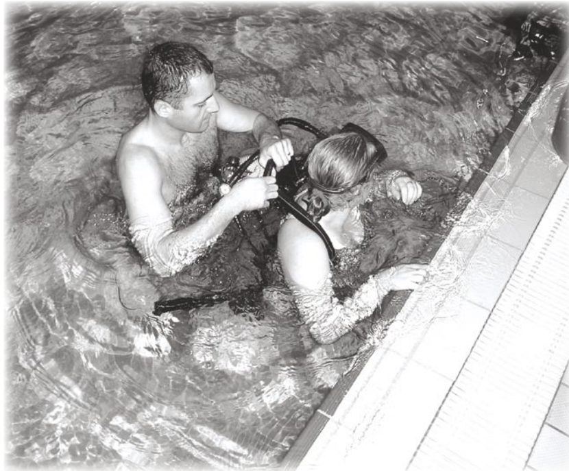
Provjera boca za kisik

tehničkih dostignuća u Zapadnom svijetu, ronjenje se sve češće uvodi kao pose-