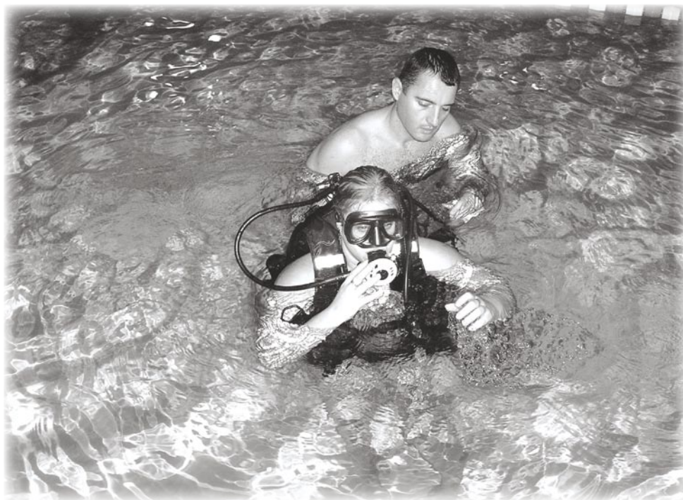
Ovako to izgleda u vodi

kineziološke aktivnosti. Uvažavajući prethodne činjenice, Udruga je započela s osmišljavanjem i realizacijom nekoliko projekata. „Projekt rekreacije i rehabilitacije za djecu s umjerenom i težom mentalnom retardacijom“ je prvi i ujedno vremenski najduži dosadašnji projekt Udruge, koji se uspješno realizira u suradnji sa Centrom za rehabilitaciju „Zagreb“, Nikole Andrića 3. Korisnici projekta su 140 štićenika Centra