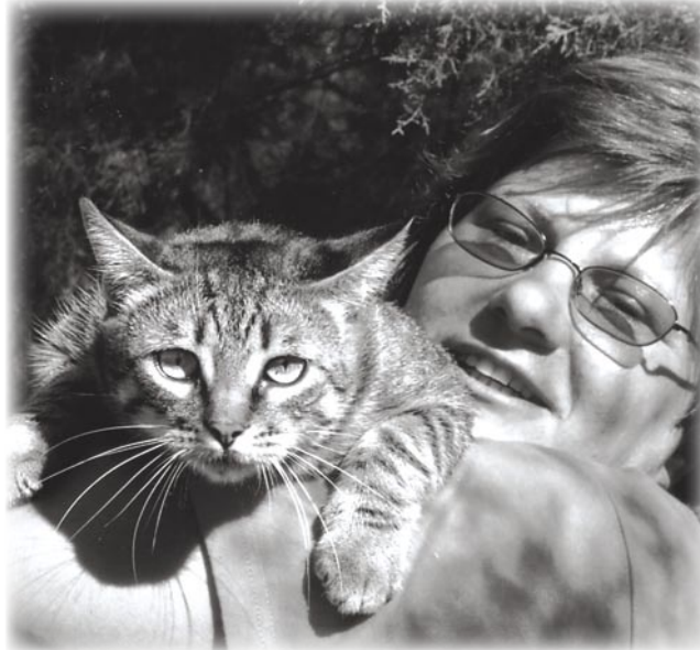
Miruna i njezin ljubimac

već N-tu na n-tu – ako nam je dopušteno malo pretjerivati prije susreta sa savršenim bićima. Možda ćemo jednoga dana s našom sugovornicom porazgovarati i o futurističkim temama. Međutim, ovo je pri-