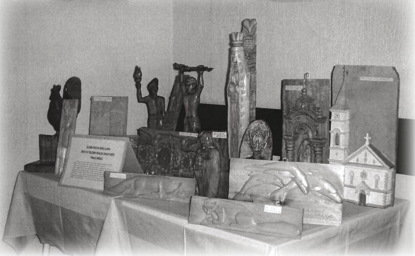
Brencovi izlošci na izložbi u Rijeci, Matulji