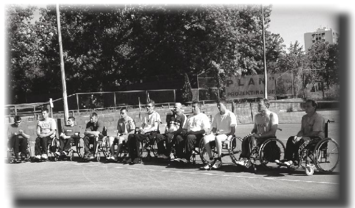
Na početku natjecanja

kvalitetom odskoču od drugih, tri-četiri koji su u zlatnoj sredini i još par njih koji su ili početnici, ili