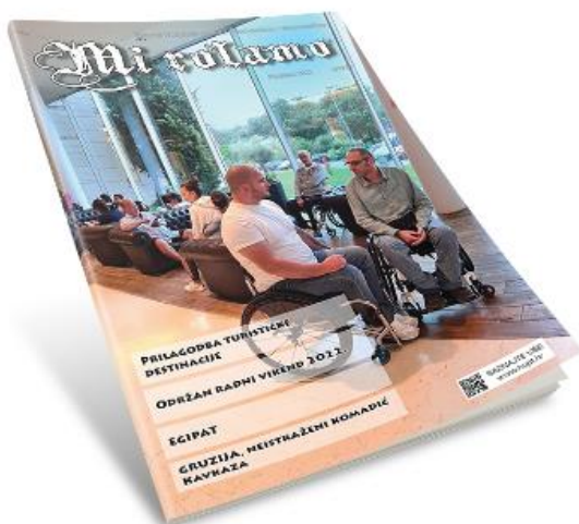
Mi rolamo broj 51, prosinac 2022.